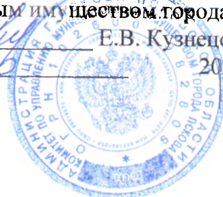
ГРАФИК проведения проверок правомерности установки и (или) эксплуатации рекламных конструкций на территории муниципального образования «Город Псков» на ноябрь 2020 года