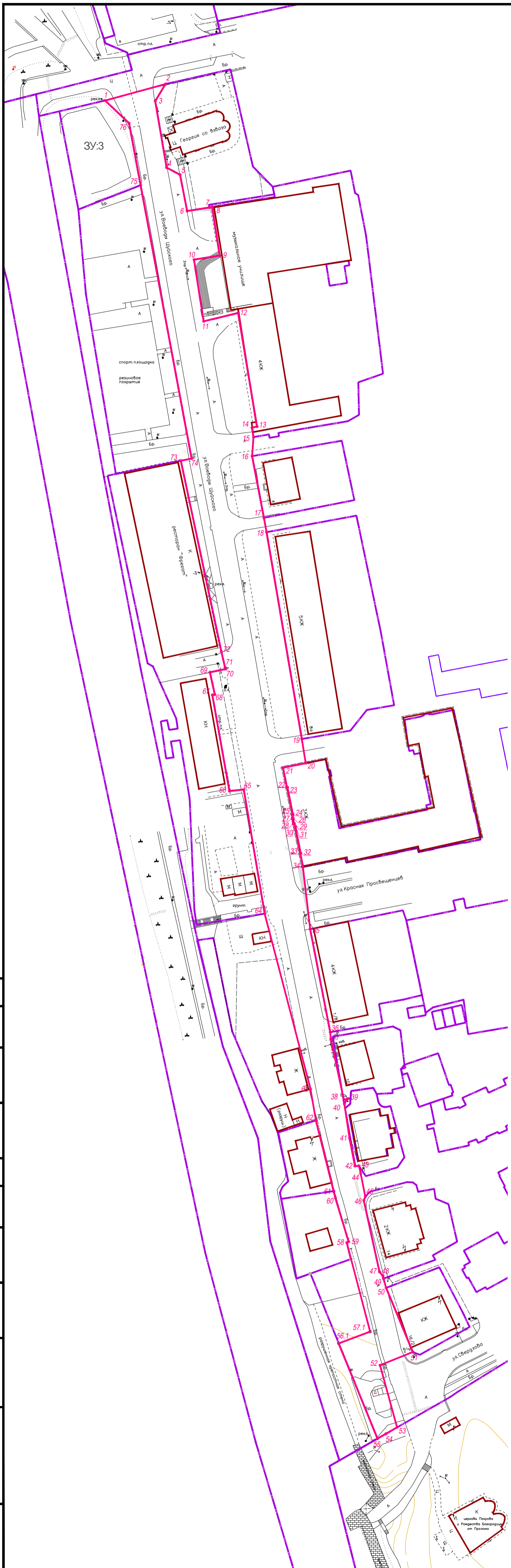
Сводка координат красных линий территории общего пользования