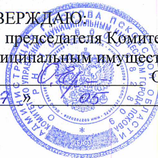
ГРАФИК проведения проверок правомерности установки и (или) эксплуатации рекламных конструкций на территории муниципального образования «Город Псков» на июнь 2021 года